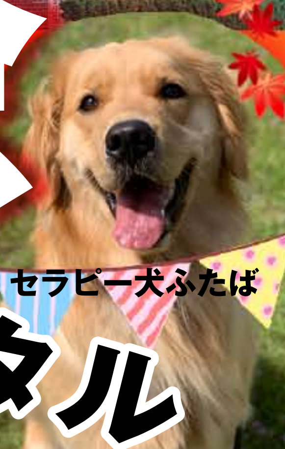
セラピー犬ふたば