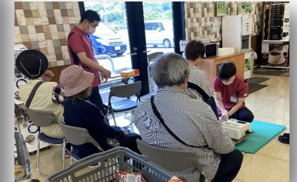
5/17 藤三 (イートイン) での様子