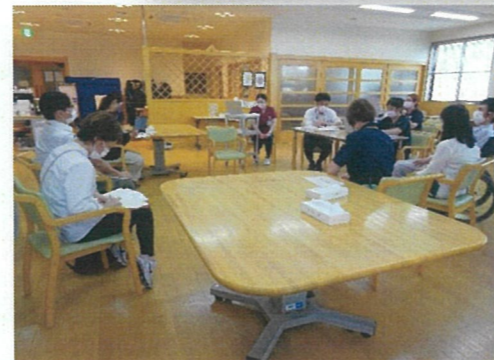
退院前カンファレンスの様子