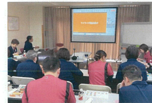
スタッフ勉強会の様子