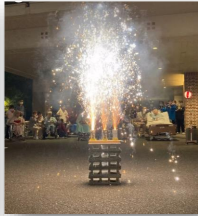
花火・盆踊り大会